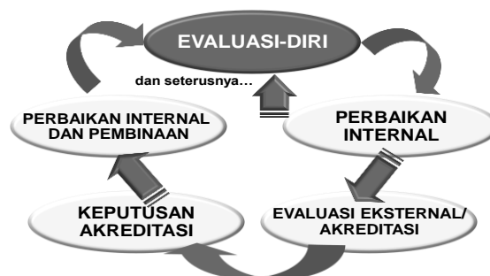
Bagan 1. Daur Penjaminan Mutu dalam Rangka Akreditasi

Seperti dikemukakan terdahulu, evaluasi-diri merupakan salah satu aspek penting dalam keseluruhan daur akreditasi dengan berbagai peran dan kegunaannya, termasuk penjaminan mutu ( quality assurance ). Keseluruhan daur penjaminan mutu dalam rangka akreditasi program studi/ perguruan tinggi itu dilukiskan dalam Bagan 1.